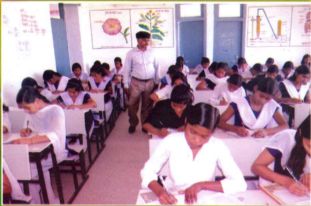
अध्ययनरत छात्राएँ, डॉ. अम्बेदकर बालिका आवासीय उच्च विद्यालय, जहानाबाद