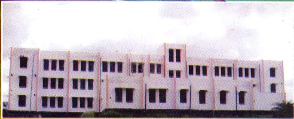
डॉ. अम्बेदकर बालिका आवासीय उच्च विद्यालय, हरपुर एलौथ, समस्तीपुर